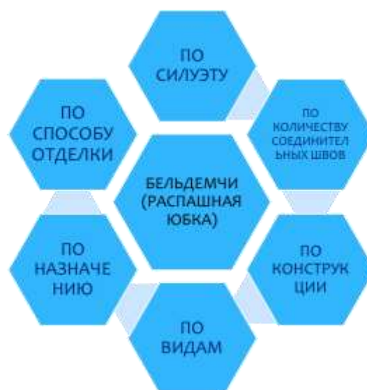
Рисунок 2. Классификация распашной юбки – «Бельдемчи»