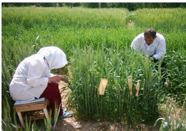
Рисунок 1 Гибридизация