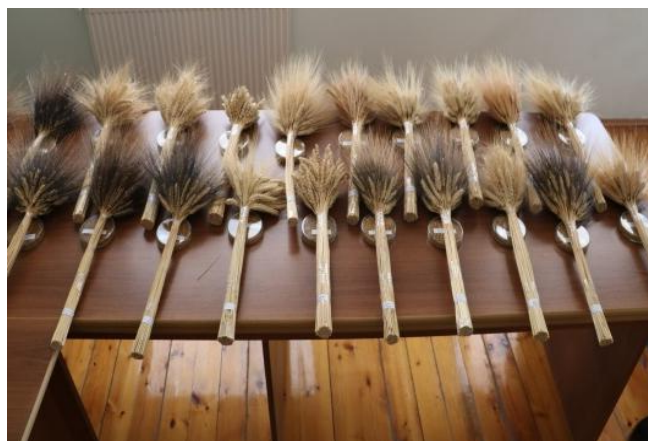
Рисунок 2. Разные гибриды

Наличие остей (длинных заостренных отростков) у пшеницы-сортовой признак, указывающий на остистые, безостые или средне остистые формы. Твердая пшеница чаще имеет длинные ости, а мягкая — короткие или их отсутствие. Ости способствуют фотосинтезу и питанию зерна, различаясь по длине, форме и цвету (белый, черный, красный).