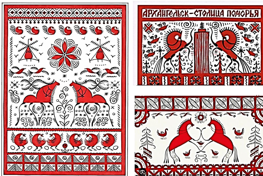
Рисунок 3. Примеры мезенской росписи ( https://clc.li/WgYCI )

Что символизируют узоры. Суть северных русских традиций и мифов пронизывает мезенскую роспись, придавая ей уникальный характер. Сложная ярусная структура узоров коренится в шаманских представлениях о трёх мирах: подземном, земном и небесном, каждый из которых изобилует символическими образами. Земля, олицетворяющая плодородие, безопасность и сотворение человека из первичной материи, изображается через квадраты. Источник жизни, вода, символизируется извилистыми линиями и диагональными штрихами. Короткие, разбросанные штрихи, напоминающие ветер, носившийся над первозданной пустотой, обозначают воздух — фундаментальный элемент бытия. Огонь, чья цикличная природа — рождение, существование, угасание и возрождение — находит отражение в спиральных, заключённых в орнаментальные рамки. Птицы, часто встречающиеся в народном творчестве как вестники благополучия, также присутствуют в мезенской росписи. Они свободно кружат в верхних ярусах, рядом с символическими «окнами», служащими каналами связи с высшими сферами. Конные образы переключаются с птичьими мотивами, отличаясь неестественно вытянутыми, тонкими ногами, завершающимися оперением. Красно-оранжевые кони, вместо того чтобы следовать друг за другом, предстают в динамичных позах — на дыбах, в выразительной борьбе, располагаясь на среднем ярусе. Чёрные лошади, изображённые в нижней части композиции, ассоциируются у искусствоведов с миром мёртвых, что подкрепляется наличием соляных знаков на их облике.