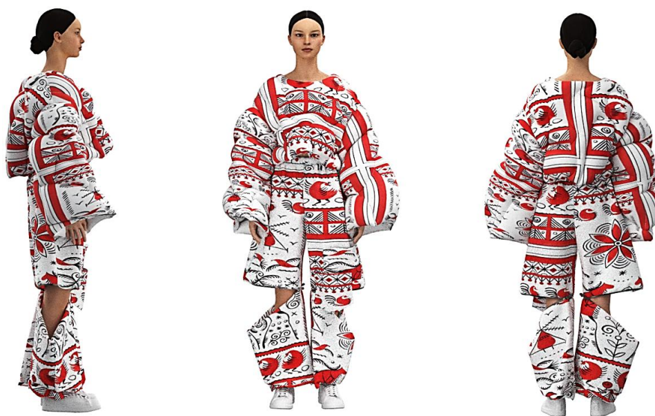
Рисунок 5. Разработка диджитал коллекции одежды на основе использования эстетики мезенской росписи (Автор — Лыкова Н. Г.)