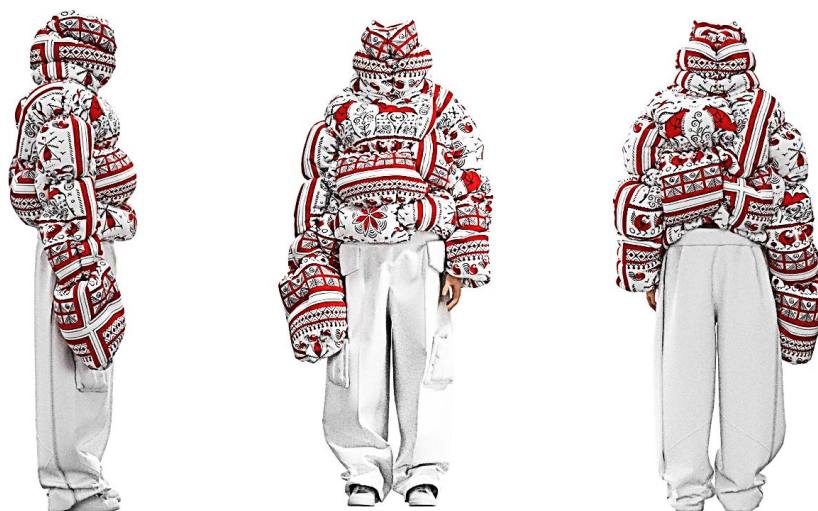
Рисунок 6. Разработка диджитал коллекции одежды на основе использования эстетики мезенской росписи (Автор — Лыкова Н.Г.)

Создание 3D моделей в программе CLO 3D. Многообразие систем трехмерного цифрового проектирования сделало задачу выбора программы 3D моделирования особенно актуальной ( https://clc.li/NZvTi ). Программное обеспечение выбирают, основываясь на требованиях к организации процесса проектирования и необходимом функционале. В настоящее время большое распространение получила программа CLO 3D, как наиболее функциональное и бюджетное программное обеспечение CLO 3D позволяет «примерить» реальные лекала на виртуального аватара и оценить особенности конструкции еще до того, как вещь будет отшита [6].