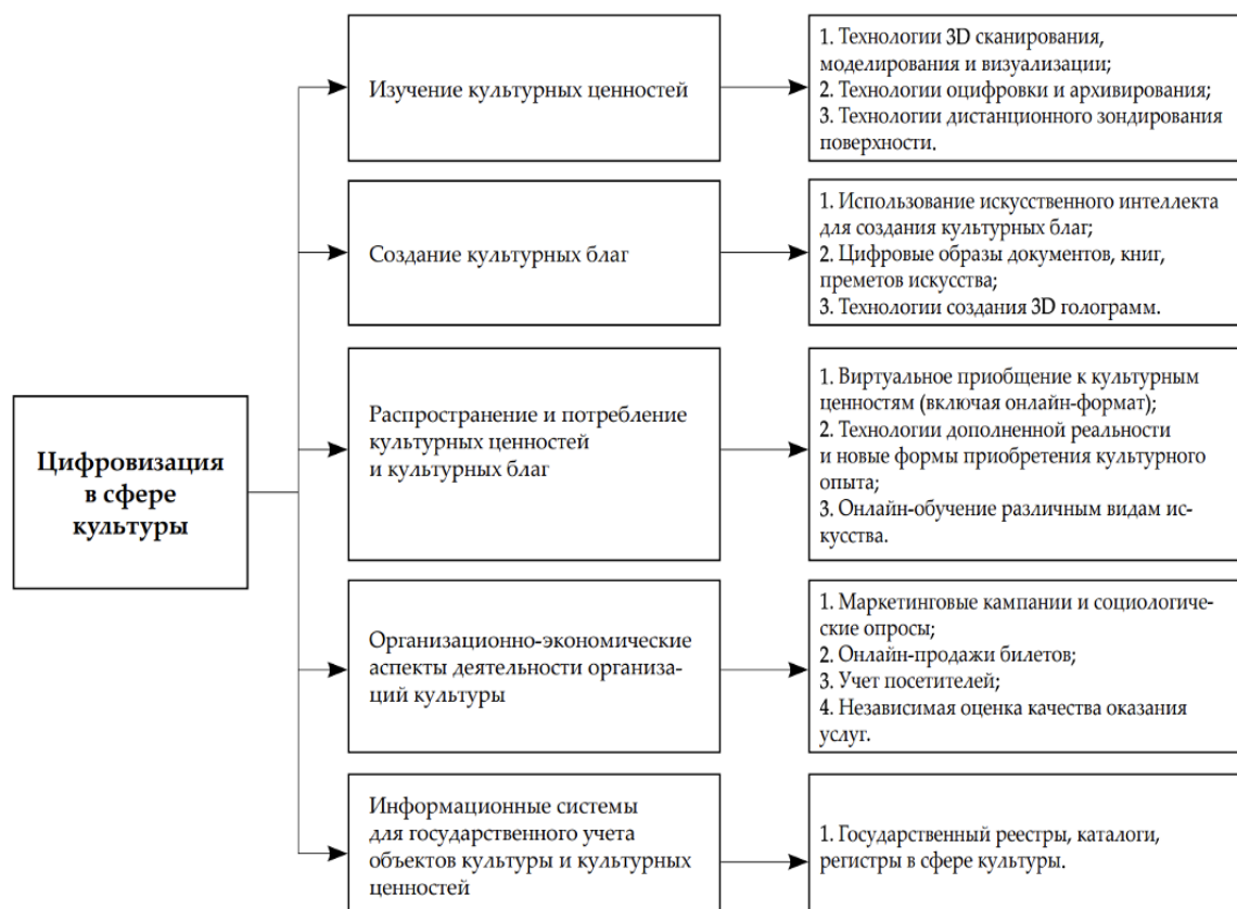
Рисунок 1. Основные направления цифровизации в сфере культуры [13]

Цифровизацию сферы культуры условно можно разделить на пять основных направлений (Рисунок 1).