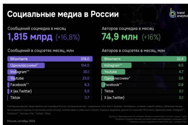
Рисунок 2. Изменение числа активных авторов и объема публикуемого контента в соцмедиа России в 2024 г в сравнении с 2023, 2022 и 2021 гг ( https://clc.li/uipSp )

к образовательным ресурсам и знаниям, позволяя людям осваивать новые области, получать доступ к высококачественным учебным материалам и обмениваться опытом. Более того, цифровой контент служит катализатором инноваций и технологического прогресса в различных секторах экономики. Развитие таких направлений, как виртуальная и дополненная реальность, интерактивные приложения и системы машинного обучения, стимулирует появление новых продуктов и услуг — от игровых платформ и медицинских приложений до облачных технологий и развлекательных сервисов. Помимо прочего, цифровые технологии позволяют реализовывать программы ранней профориентации, например, обучая будущих IT — специалистов еще на школьной скамье, что помогает учащимся осознанно выбирать дальнейший образовательный и карьерный путь. Brand Analytics обнародовал результаты своего ежегодного исследования, посвященного активным пользователям (авторам) российских социальных сетей, проведенного в октябре 2024 г ( https://clc.li/uipSp ) (Рисунок 2).