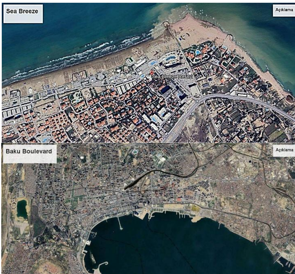
Рисунок 2. Спутниковые снимки “Sea Breeze” и Приморского бульвара, 2026 г ( https://earth.google.com/web/search/Baku/ )

Сравнительный анализ показывает, что при сопоставимых площадях озеленения Приморский бульвар обладает более высокой экологической значимостью и пространственной связностью, тогда как комплекс “Sea Breeze” выполняет преимущественно локальные декоративно-рекреационные функции. Пространственное распределение зелёных