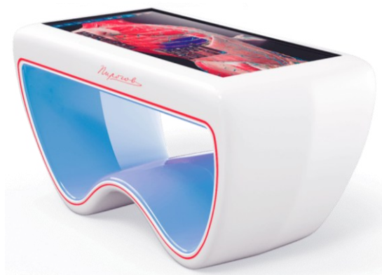
Рисунок 1. Интерактивный анатомический стол «Пирогов II»

Изучение предмета посредством поверхностной анатомии осуществляется с помощью виртуальных слайд-презентаций в условиях дистанционного обучения, что можно дополнить симуляционными или живыми моделями. Последние позволяют студентам изучать предмет методом пальпации, как это обычно делается при осмотре пациента [17, 18].