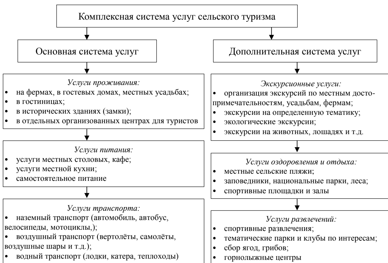
Рисунок 1. Комплексная система услуг сельского туризма

- основным направлением обеспечения эффективного функционирования сельского гостевого хозяйства является соотношение «цена-качество», которое либо позволяет удерживать конкурентоспособные цены относительно низкие цены, либо обосновывать повышение цены за счёт улучшения качества. Ценовой фактор является одним из самых важных при формировании потребительского спроса. Если цена за услуги гостевого дома будет конкурентоспособной, а условия проживания и питания будут на достойном уровне для данной цены, то нет оснований полагать, что предлагаемые услуги не будут пользоваться спросом (Рисунок 1).