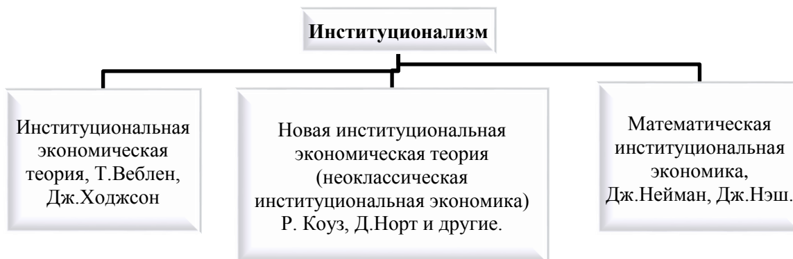
Рисунок 2. Классификация институциональных течений.

Основные направления развития институционализма представлены на Рисунке 2.