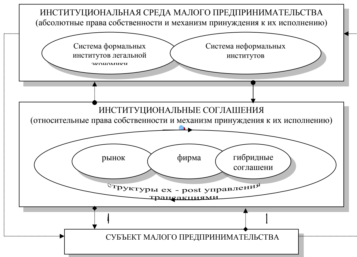
Рисунок 3. Схема анализа институциональной среды малого предпринимательства

Благодаря названным свойствам замещения или дополнения институтов, последние имеют место как внутри формальных, так и неформальных правил. Однако мы не станем углубляться в изучение свойств институтов, а перейдем к исследованию механизмов взаимодействий формальных правил с неформальными. В литературе условно выделяют пять типов механизмов [43].