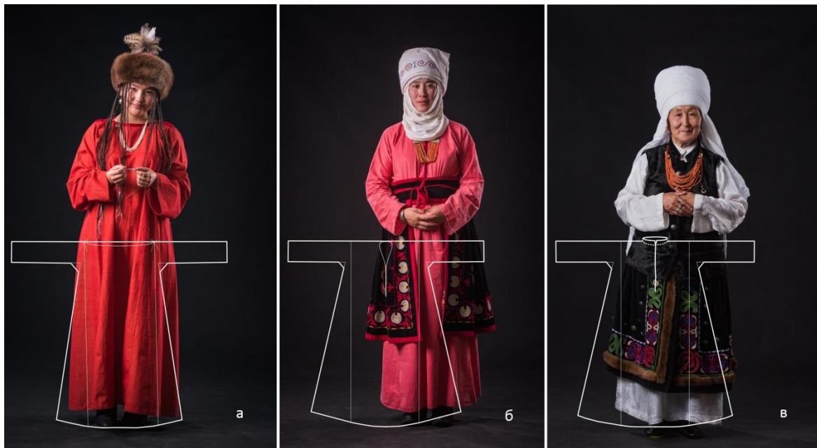
Рисунок 9. Женское платье (а) «туура жака», (б) «узун жака», (в) «ит жака»

систему комбинаций, а главное повествовательность узора попытался выяснить М. В. Рындин [12].