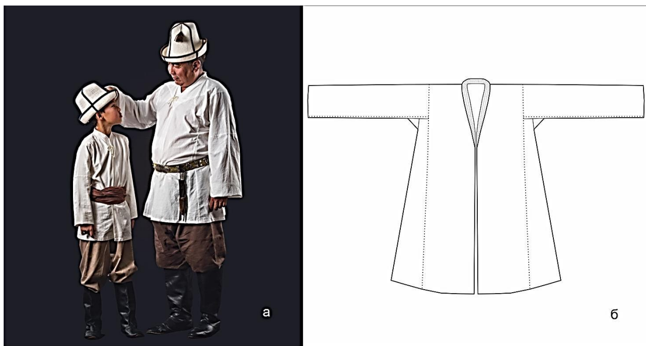
Рисунок 1. Распашная рубаха «жегде» (а), покрой распашной рубахи (б)

Нательная одежда представляла собой распашные рубахи «жегде», «ачык кёйнөк» и шаровары «шым» (Рисунок 1). По традиции у киргизов было принято приносить в дар распашную рубаху «жегде» вместе с шароварами «дамбал» новым родственникам, как правило свекру [ПМА 1].