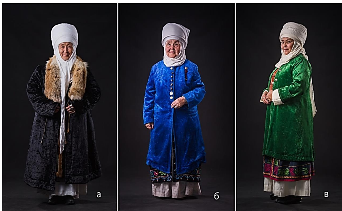
Рисунок 11. Верхняя женская одежда (а) лисья шуба «тулку ичик», (б) «кемсел», (в) «чапан»

По одежде женщин, а именно по головному убору элечек, по набедренной юбке бельдемчи и по форме воротника можно было отличать из какого она племени, социальный статус, возраст а также региональную особенность. В качестве верхней зимней одежды женщины носили меховые шубы «ичик» (Рисунок 11).