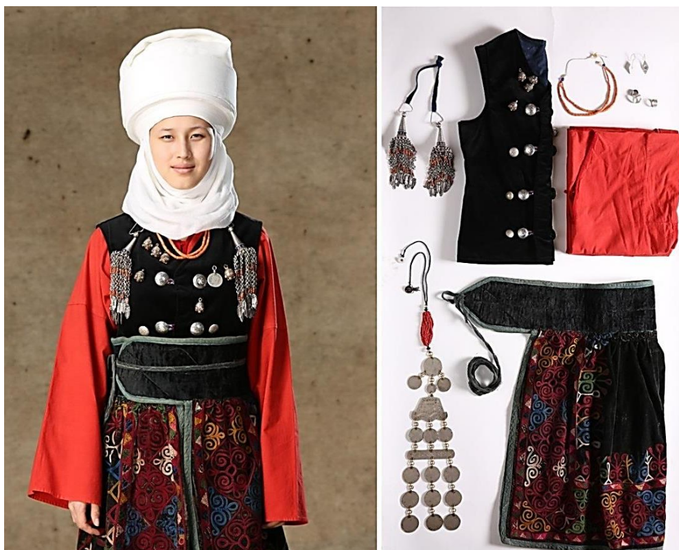
Рисунок 15. Украшения женского костюма

«сөйкө желбирөөч» и накосные украшения «чач учтук» характеризовали возрастные различия. Женщины носили накосные украшения после замужества. Накосные украшения имели региональные отличия. Например, накосное украшение «күбөк» характерны для традиционного костюма северо-западного региона. Подобное видоизмененное украшение встречается и на юге, а в других регионах встречается редко. Накосные украшения по традиции передавались как подарок вместе с приданным, а также после смерти женщины дальним родственникам. Каждое украшения киргизских кочевниц соответствовало своей возрастной категории и имело свое дисциплинирующее воспитательное воздействие (Рисунок 15).