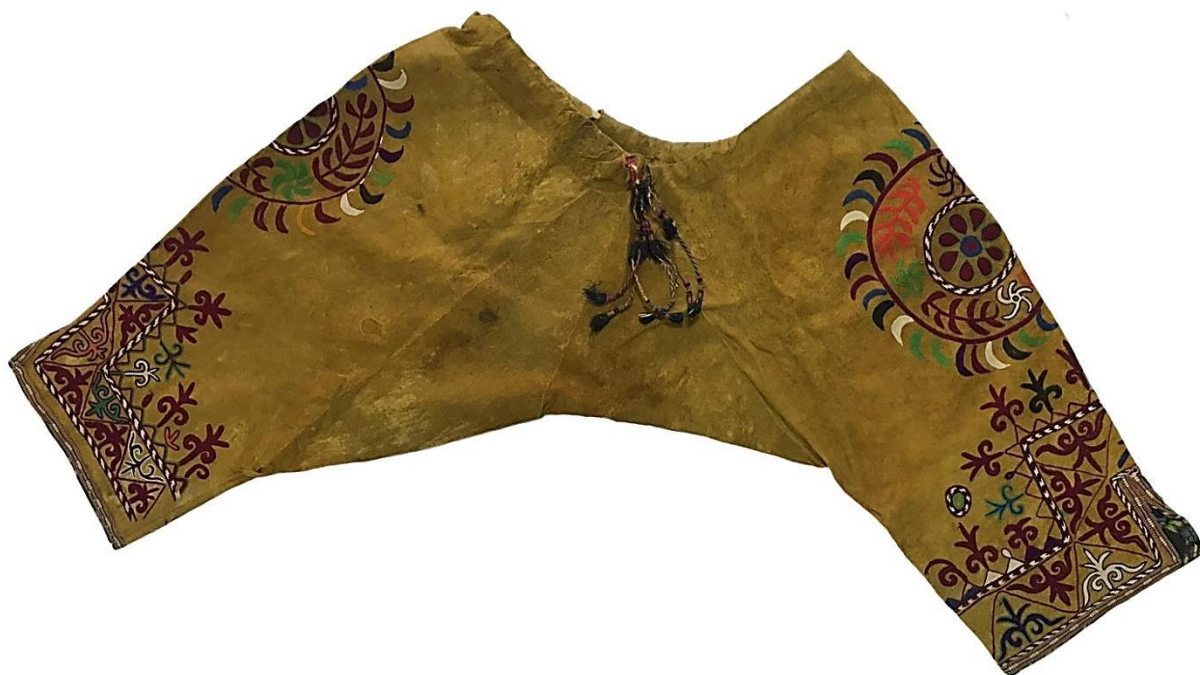
Рисунок 3. Штаны из козьей шкуры