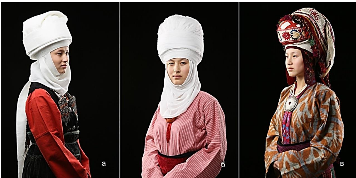
Рисунок 13. Женский головной убор (а) «элечек», (б) «илеки», (в) «келек»