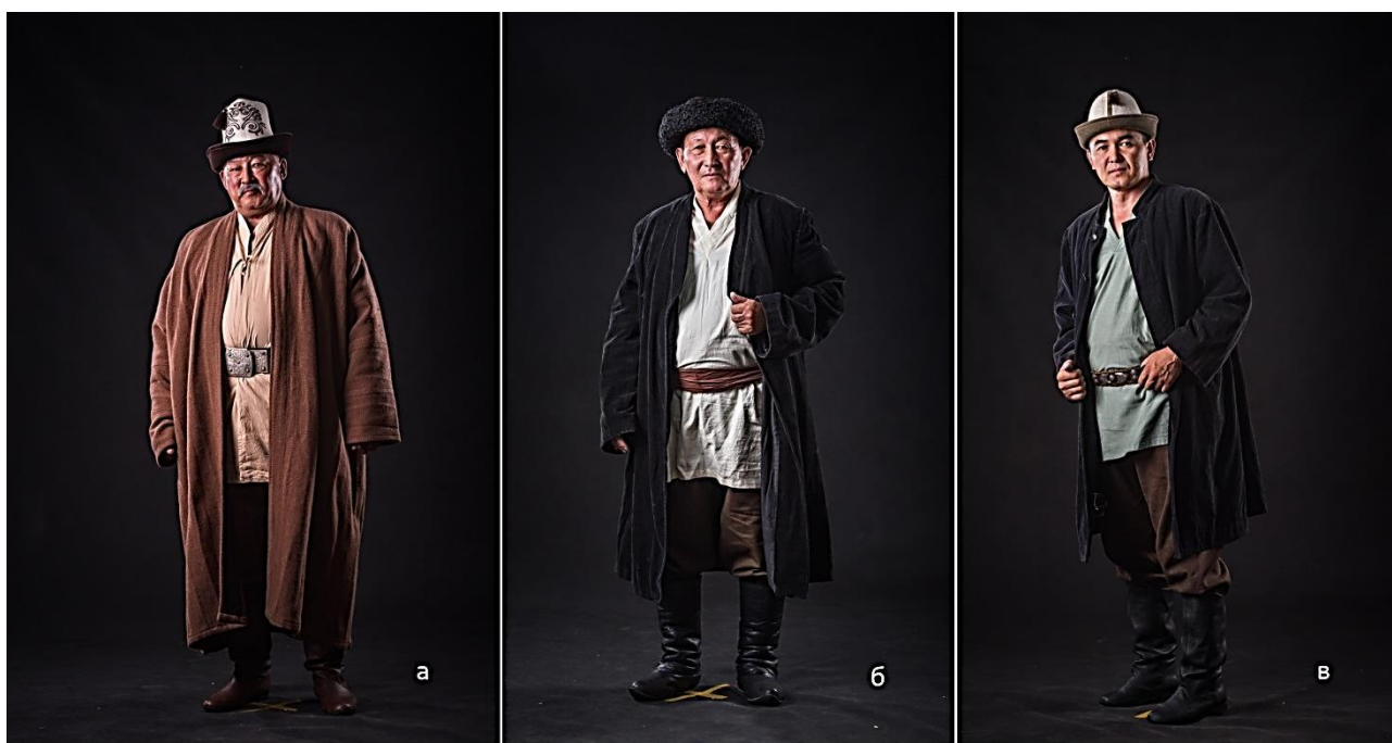
Рисунок 4. Некоторые виды верхней мужской одежды (а) «басма чепкен», (б) «желек чепкен» с открытым воротником, (в) «желек чепкен» с стоячим воротником

Традиционно «чепкен» шили длиннополым, с широкими и длинными рукавами без подкладки. Такой крой позволял одевать «чепкен» поверх другой верхней одежды. Одежду из верблюжьей шерсти шили только для мужчин. «Чепкен» из верблюжьей шерсти «пийязы чепкен» разрешалось изготавливать только женщинам пожилого не детородного возраста. Изготовление «пийязы чепкена» было весьма трудоемким и дорогим [ПМА 4].