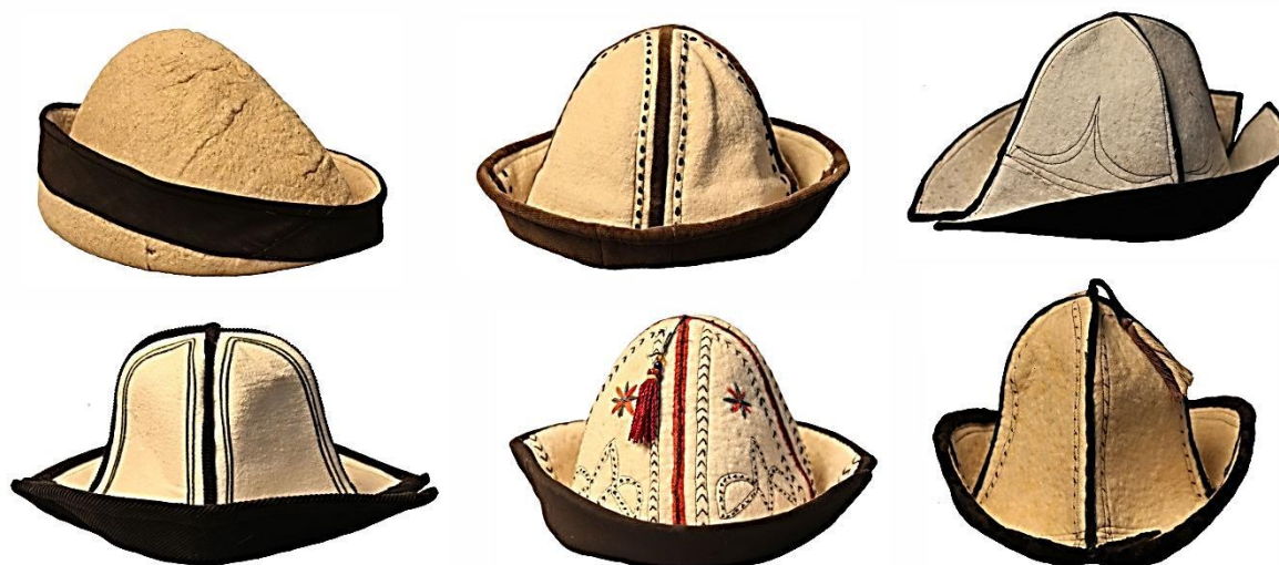
Рисунок 6. Мужские головные уборы

Обязательным атрибутом мужской одежды является пояс — «кемер», ремень — «илгич» с принадлежностями. Как правило, пояс одевали поверх халатов «чепкен». Подпоясывались кушаком «бел боо» из длинной ткани разных цветов, обычно обхватывающего талию 2–3 раза и завязанный спереди. Кушак должен быть завязан четко, плотно и не в коем случае не должны торчать концы. По традиции считалось, что туго затянутый пояс характеризует мужчину как серьезного дисциплинированного человека.