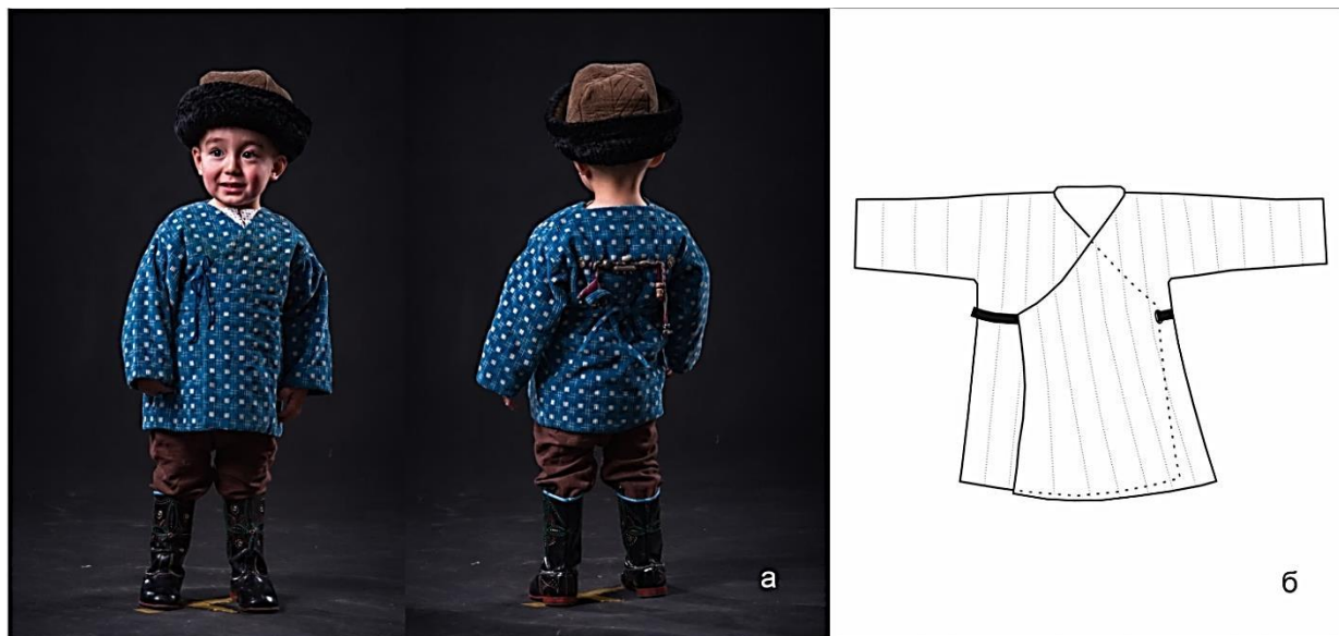
Рисунок 8. Детская одежда (а) комплект детской одежды, (б) покрой детского «чапана»

Женщины также как и мужчины носили нательную и верхнюю одежду. В качестве женской нательной одежды женщины носили подштанники на завязках «дамбал», «лаазым». Этот элемент женской нательной одежды имел и традиционное воспитательное значение при планировании рождения детей. В качестве предостережения при планировании рождения детей молодой женщине говорили: – «у тебя развязаны завязки на подштанниках (ычкыры бош), поэтому ты рождаешь каждый год» [ПМА 2].