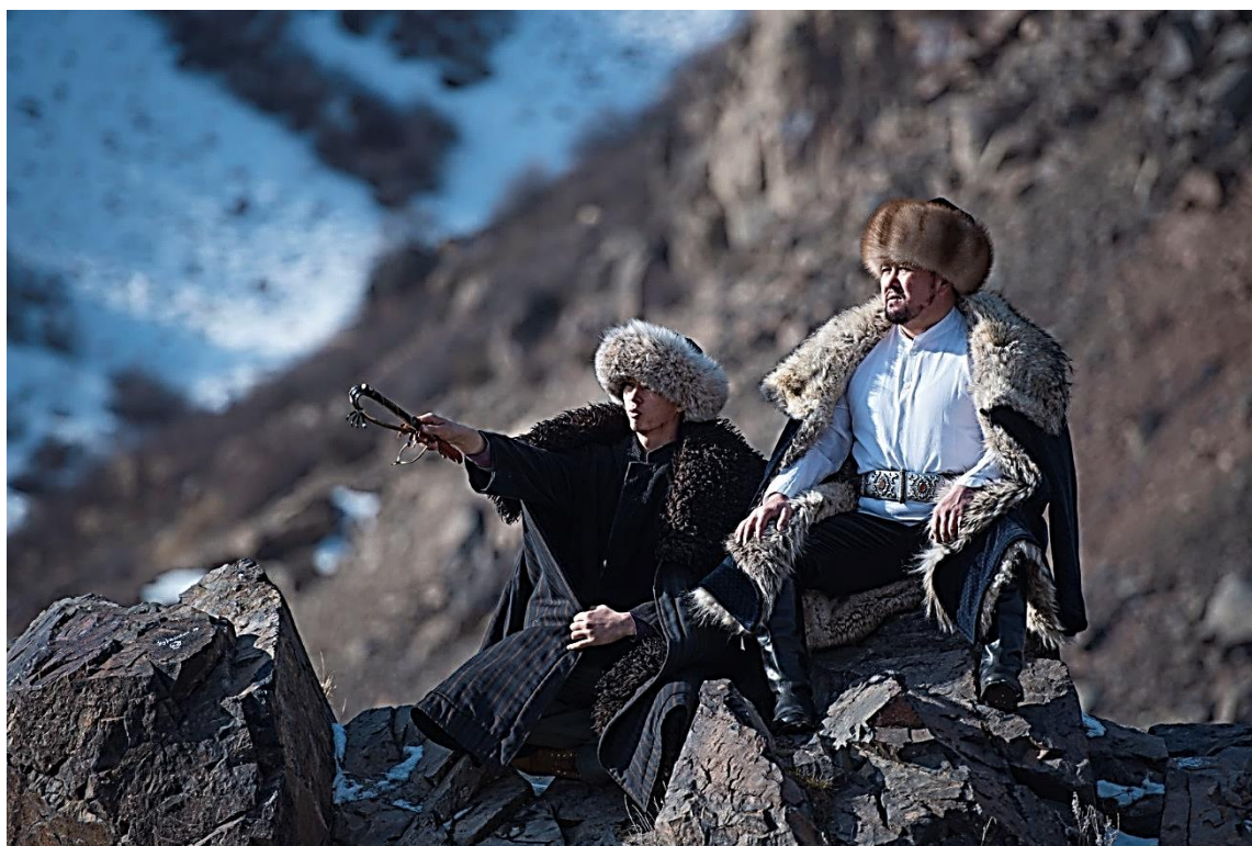
Рисунок 5. Виды верхней зимней одежды слева овчинная шуба «көрпө ичик», справа шуба из волчьей шкуры «карышкыр ичик»

Согласно традиции мужчина не мог выйти на улицу без головного убора. Головной убор нельзя было положить на землю. По киргизской традиции головной убор никогда не дарили чужакам. Основным головным убором мужчин у киргизских кочевников является войлочная шляпа — колпак, в первую очередь это «ак колпак» — войлочная шляпа белого цвета. Традиционно колпак изготавливали женщины в двух видах: — цельноваленный колпак «туюк колпак» без единого шва и сшитый колпак двухполый и четырехполый. Некоторые мастерицы изготавливали из толстого войлока теплый колпак для зимнего периода. Под белым колпаком и меховым головным убором «тебетей» носили тонкую шапочку «аракчын» сшитую из цельного куска хлопчатобумажной ткани с помощью простегивания. В зависимости от погодных условий мужчины носили тюбетейки — «топу», меховые шапки без отворотов — «малакай», меховые шапки — «тебетей».