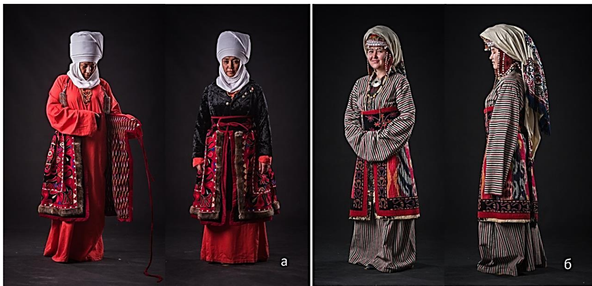
Рисунок 10. Набедрная одежда женщин «бельдемчи» (а) северного региона, (б) южного региона

Орнамент в народном сознании всегда обладал магической силой и имел специфическое название. Элементы орнамента служат еще и эстетическим целям, делая вещь более красивой и ценной и при восприятии гармонизирует психоэмоциональное состояние представителей киргизского народа. Сакральные символы, спрятанные в узорах, передавали мысли, молитвы и надежды кочевников [13].