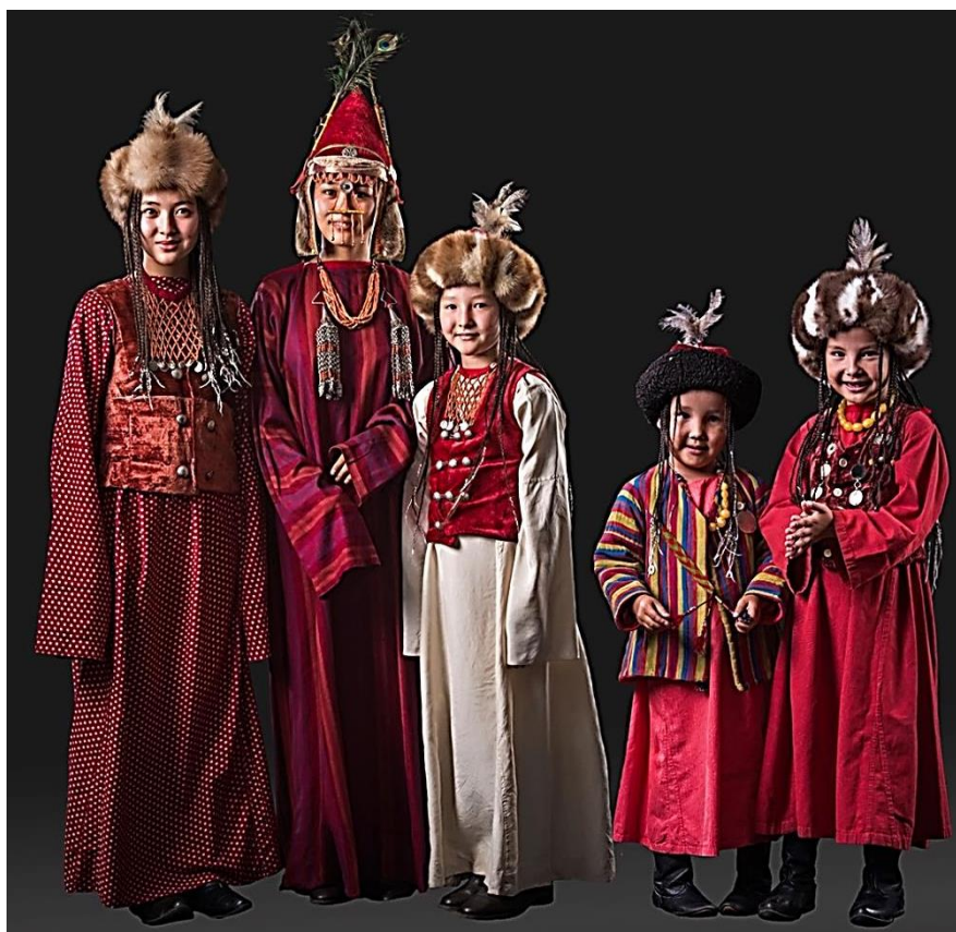
Рисунок 14. Головной убор девочек, девушек и невесты

Головными уборами девочек и девушек были «топу» – разновидность тубетейки и меховая шапка «тебетей». «Тебетей» шили из мехов выдры, куницы, или из мерлушки — шкуры ягнят. Крой тебетей всегда состоял из четырех клиньев. При пошиве верхней части «тебетей» использовали такие ткани как бархат, сукно, шелк, адрас. Верх «тебетей» украшали перьями, бусами, деталями из серебра и большой кисточкой в основном черного цвета (Рисунок 14). Традиционным головным убором невесты была шлемовидная шапка с украшениями «шөкүлө».