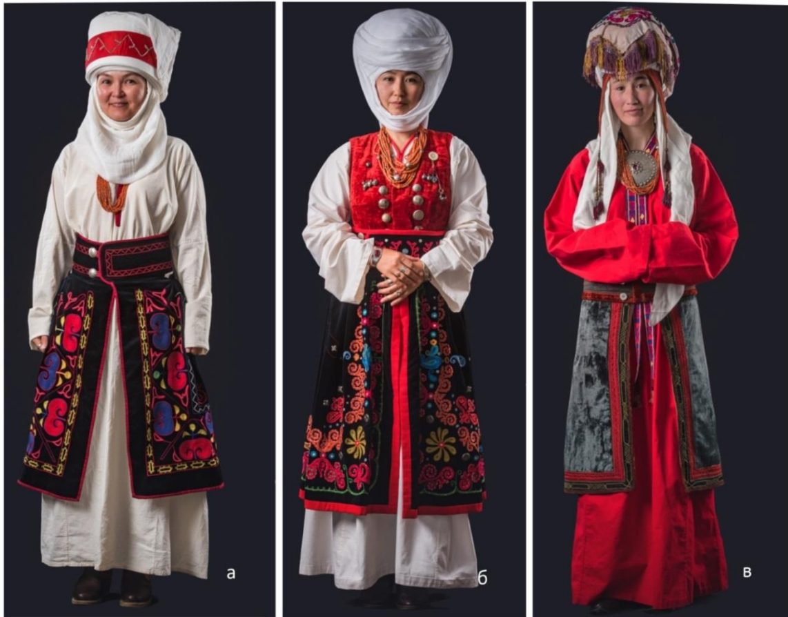
Рисунок 12. Некоторые виды комплекта женского костюма (а) северный, (б)северо-западный, (в) южный

моментом в жизни невесты и символизирует переход от одного возраста к другому. В обряде наматывания «элечека» участвуют только женщины, мать невесты, бабушки, жена брата, жены старших братьев по линии отца и матери, сестры и со стороны мужа, мать мужа и родственники мужа.