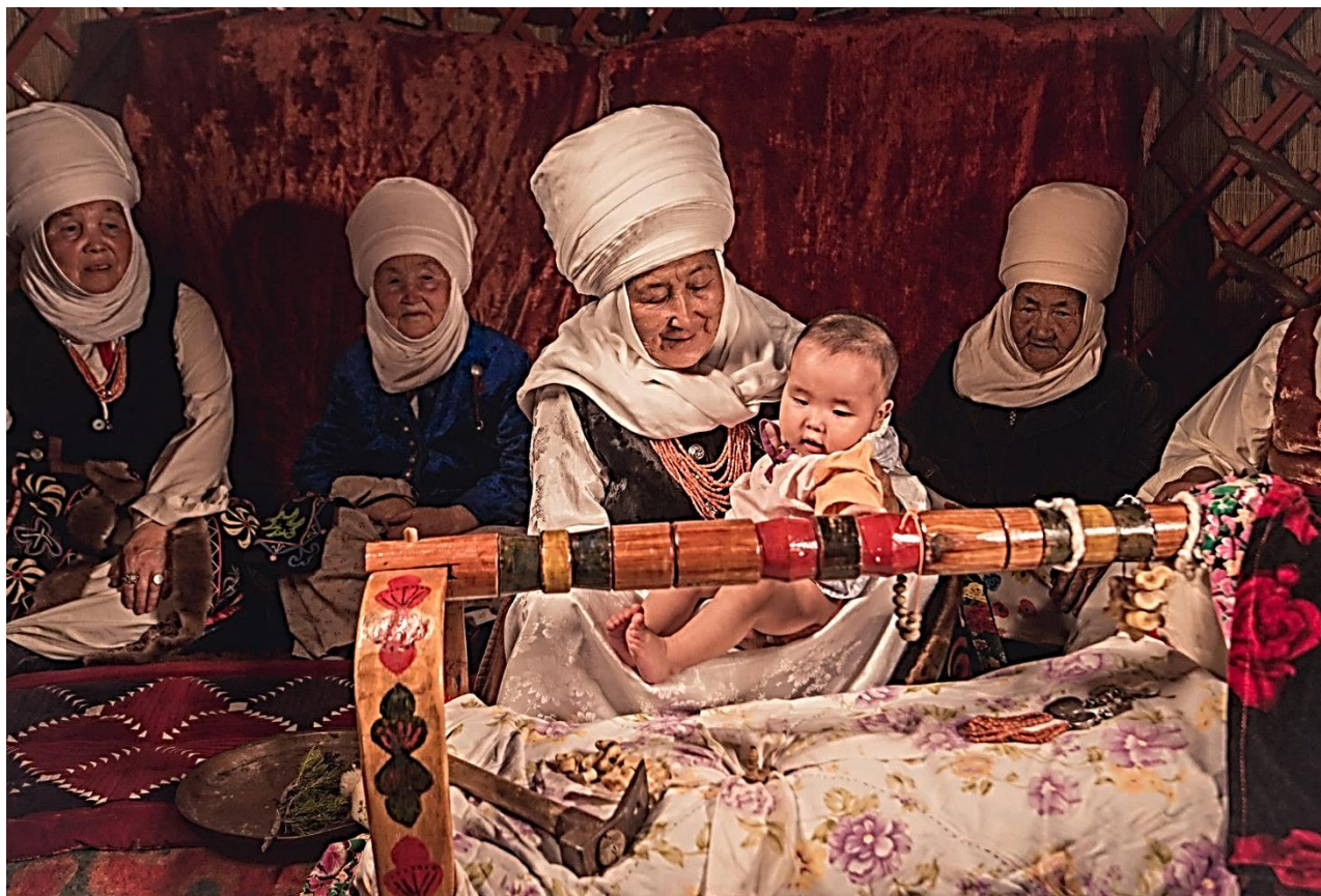
Рисунок 7. Обряд помещения ребенка в колыбель

Бытовало мнение, что энергия верхней одежды отцов и дедушек будет защищать ребенка и даст ему крепкий и здоровый сон. Головной убор «топу» для ребенка шили из мягкой ткани и утепляли, прокладывая вату. Штаны из хлопчатобумажной ткани ребенку одевали с того времени, когда он начинал сидеть. Поверх рубашек детям одевали безрукавки на вате или шерсти с плечевыми и боковыми завязками для удобства. В качестве верхней одежды детям шили «чапаны» без воротников с большими завязками под мышками. Обычно нижний край спинки «чапана» оставляли открытыми, что означало желание рождения последующих детей [ПМА 5].